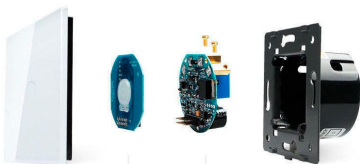
Luxury crystal Glass panel

Perceive the essence through the appearance