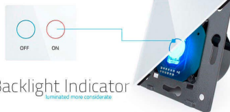
Backlight Indicator Illuminated when convenient