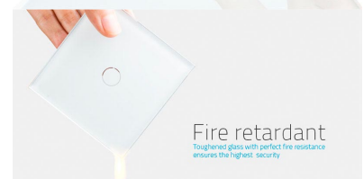
Fire retardant Toughened glass with perfect fire resistance ensures the highest security