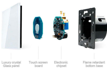
Luxury crystal Glass panel

Perceive the essence through the appearance