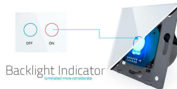
Backlight Indicator Illuminate more conveniently