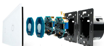
Luxury crystal Glass panel Touch screen board Electronic chipset Flame retardant bottom base

Perceive the essence through the appearance