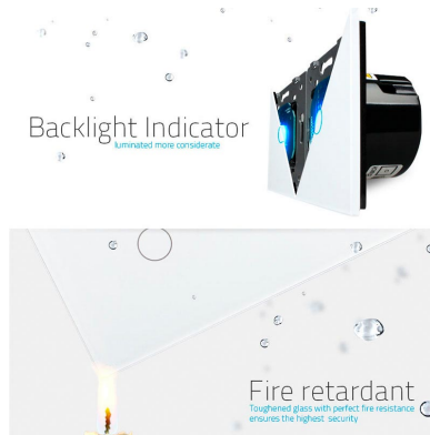
Fire retardant Tempered glass with perfect fire resistance ensures the highest security