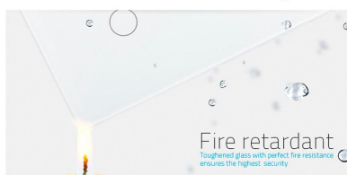
Fire retardant Tempered glass with perfect fire resistance ensures the highest security