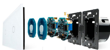
Luxury crystal Glass panel Touch screen board Electronic chipset Flame retardant bottom base

Perceive the essence through the appearance