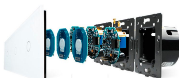
Luxury crystal Glass panel Touch screen board Electronic chipset Flame retardant bottom base