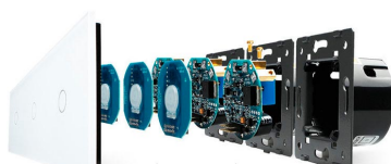
Luxury crystal Glass panel Touch screen board Electronic chipset Flame retardant bottom base