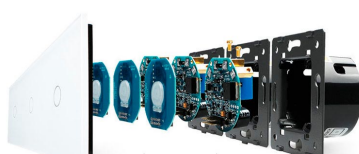
Luxury crystal Glass panel Touch screen board Electronic chipset Flame retardant bottom base