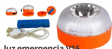
luz emergencia V16 homologada DGT