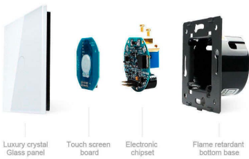
Luxury crystal Glass panel

Perceive the essence through the appearance