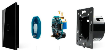
Luxury crystal Glass panel Touch screen board Electronic chipset Flame retardant bottom base