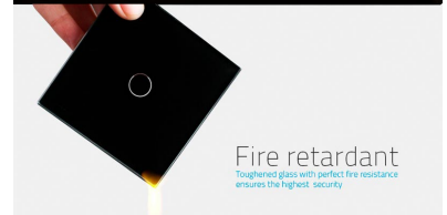
Toughened glass with perfect fire resistance ensures the highest security Fire retardant