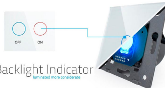
Backlight Indicator Illuminated more conveniently