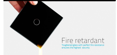
Fire retardant Toughened glass with perfect fire resistance ensures the highest security