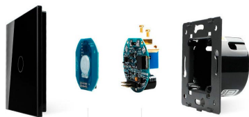
Luxury crystal Glass panel Touch screen board Electronic chipset Flame retardant bottom base