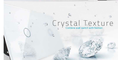
Crystal Texture Combine wall switch with fashion