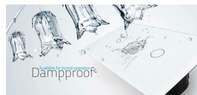
Dampproof Available for humid operation