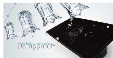
Available for humid scenarios Dampproof