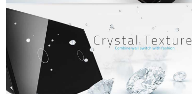
Crystal Texture Combine wall switch with fashion