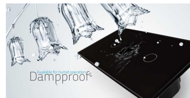
Available for humid spaces Dampproof