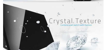
Crystal Texture Combine wall switch with fashion