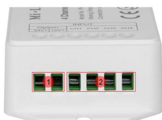
Import port 1. Import power supply cable port 2. Import LED strip connecting port