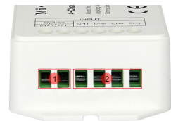
Input port 1. Input power supply cable port 2. Input LED strips connecting port