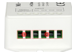
Input port 1. Input power supply cable port 2. Input LED strips connecting port